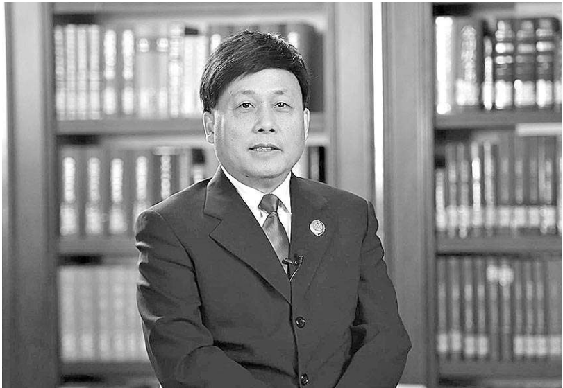
最高人民检察院检委会副部级专职委员、第三检察厅厅长史卫忠接受记者采访。