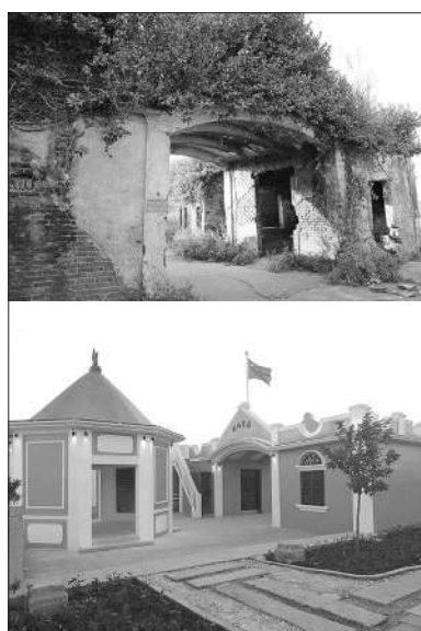
梅阁码头修缮前后对比图

2023年12月28日,江门市人大常委会通过《关于加强检察公益诉讼工作的决定》,明确检察机关应当根据江门侨乡特点,深入推进“侨都赋能”司法实践,依法办理涉侨公益诉讼案件,平等保护华侨华人和归侨侨眷的合法权益。