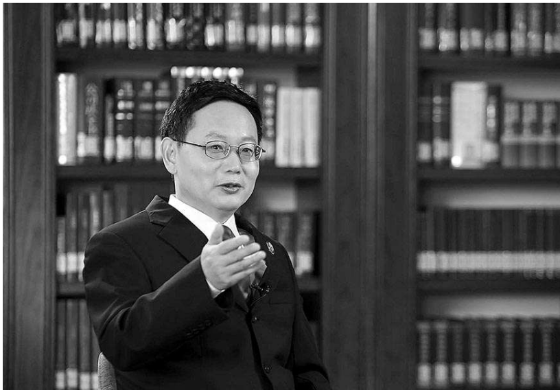
最高人民检察院检委会副部级专职委员、第一检察厅厅长苗生明接受记者采访。