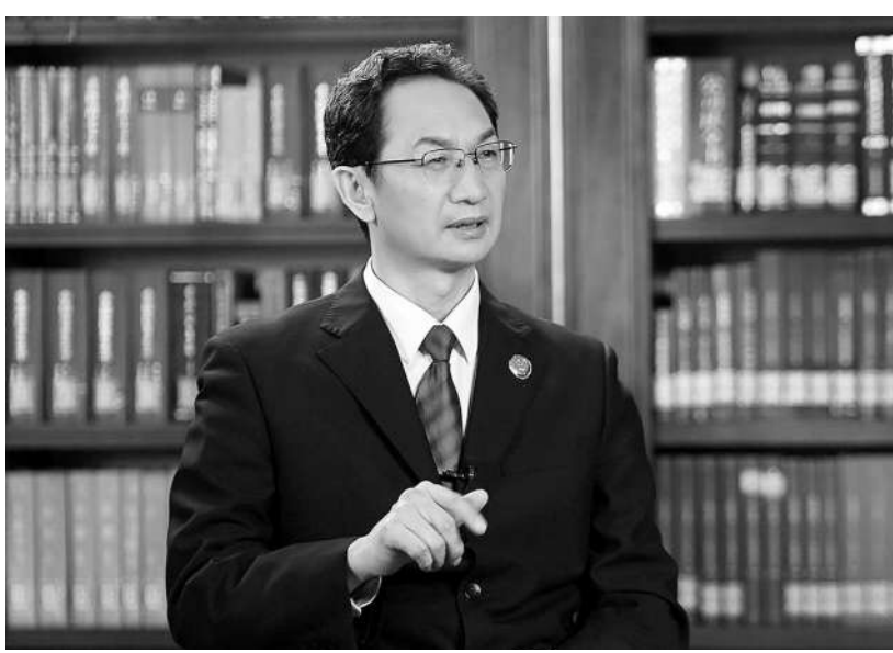
最高人民检察院政治部常务副主任滕继国接受记者采访。