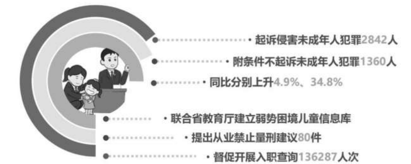
2023年安徽省检察机关强化未成年人检察综合履职情况。制图/李浩

本报讯(记者吴盼伏)“过去一年,安徽省检察机关加强未成年人检察综合履职,办理综合履职案件909件,联合省教育厅建立弱势困境儿童信息库,提出从业禁止量刑建议书80件,督促开展入职查询136287人次。该省检察机关起诉侵害未成年人犯罪2842人、附条件不起诉未成年人犯罪1360人,分别同比上升4.9%、34.8%。”1月27日上午,安徽省十四届人大二次会议第三次全体会议表决通过了安徽省检察院检察长陈武所作作的《安徽省人民检察院工作报告》。陈武向大会报告时提到的检察机关强化对未成年人综合履职,成为代表们议论最多的话题之一。