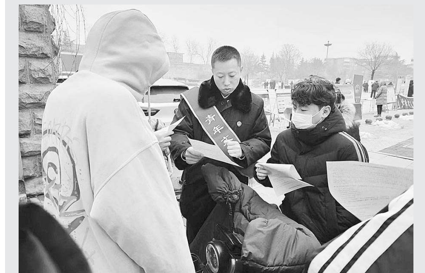
春节将近,1月18日,河北省邯郸市峰峰矿区检察院组织检察干警走上街头,开展防范酒驾醉驾普法宣传活动。检察干警围绕“两高两部”联合发布的《关于办理醉酒危险驾驶机动车刑事案件的意见》进行宣传和解读,通过发放宣传资料、接受法律咨询等方式,引导群众知法守法,安全出行,喜迎春节。

调查终结后,张湾区检察院向法院提出“建议不予决定暂予监外执行”的意见,同时依据相关法律规定,督促尽快将毛某收监。目前,毛某已经被收监于看守所,等待她的将是五年刑期的监狱改造生涯。