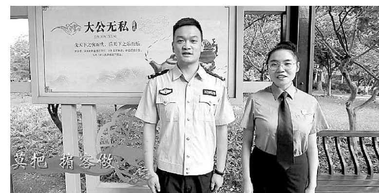
张家港市检察院干警唱响《港检正气歌》。