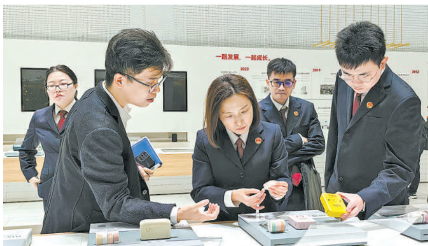
近日,湖北省武汉市江岸区检察院“知岸检行”办案团队走访武汉精臣智慧标识科技有限公司,帮助企业解决涉法难题。

编者按 开展全国检察机关文化品牌选树活动,是检察机关深入践行习近平法治思想、习近平法治文化思想,纵深推进检察文化建设的重要举措。近日,第三届全国检察机关十佳文化品牌揭晓。为集中展示检察文化建设成果,挖掘品牌背后的故事,引领全国检察机关深入开展检察文化品牌培育工作,将检察文化软实力转化为高质量法律监督新动能,本报今起推出“第三届全国检察机关十佳文化品牌”系列报道,敬请关注。