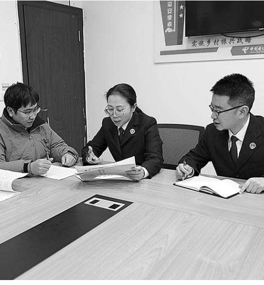
检察官与当地镇政府相关负责人共商整改措施。