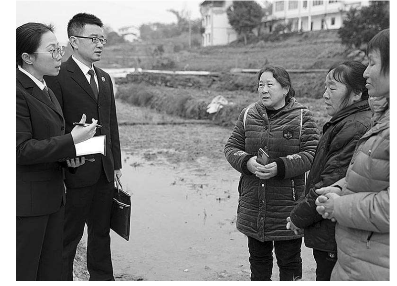
检察官向群众了解河道内渣土带相关情况。