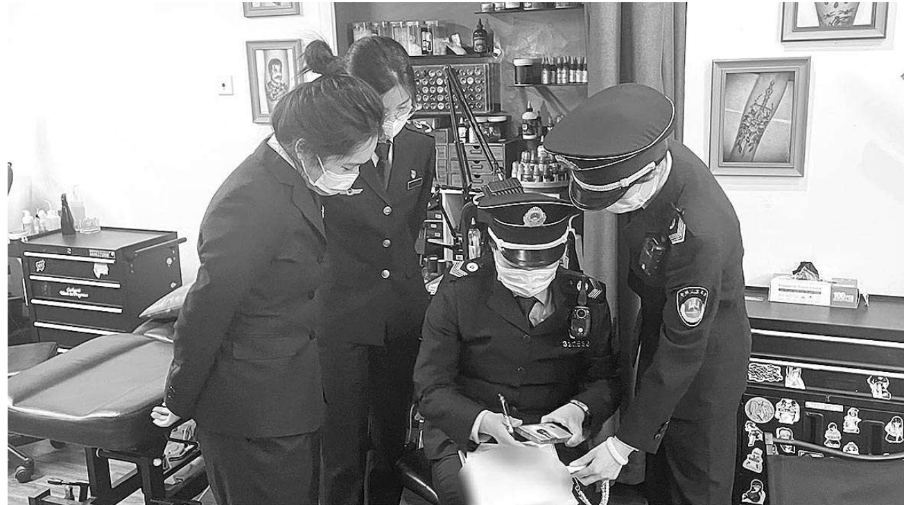
上海市静安区检察院检察官走访医疗美容服务行业店铺。

“我们没有实际开展医美服务”“网上那些宣传文案都是复制粘贴来的,我们弄错了”“说可以祛痣是为了引流”……调查时,办案检察官遇到前所未有的阻力,多家店铺经营人员都矢口否认自己在无证状态下开展医美服务,也不承认曾经从事祛痣、文