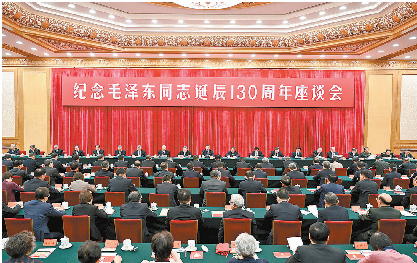
12月26日,中共中央在北京人民大会堂举行纪念毛泽东同志诞辰130周年座谈会。习近平、李强、赵乐际、王沪宁、蔡奇、丁薛祥、李希、韩正等出席座谈会。

新华社北京12月26日电 中共中央26日上午在人民大会堂举行座谈会,纪念毛泽东同志诞辰130周年。中共中央总书记、国家主席、中央军委主席习近平发表重要讲话。他强调,毛泽东同志是伟大的马克思主义者,伟大的无产阶级革命家、战略家、理论家,是马克思主义中国化的伟大开拓者、中国社会主义现代化建设事业的伟大奠基者,是近代以来中国伟大的爱国者和民族英雄,是党的第一代中央领导集体的核心,是领导中国人民彻底改变自己命运和国家面貌的一代伟人,是为世界被压迫民族的解放和人类进步事业作出重大贡献的伟大国际主义者。毛泽东思想是我们党的宝贵精神财富,将长期指导我们的行动。对毛泽东同志的最好纪念,就是把他开创的事业继续推向前进。