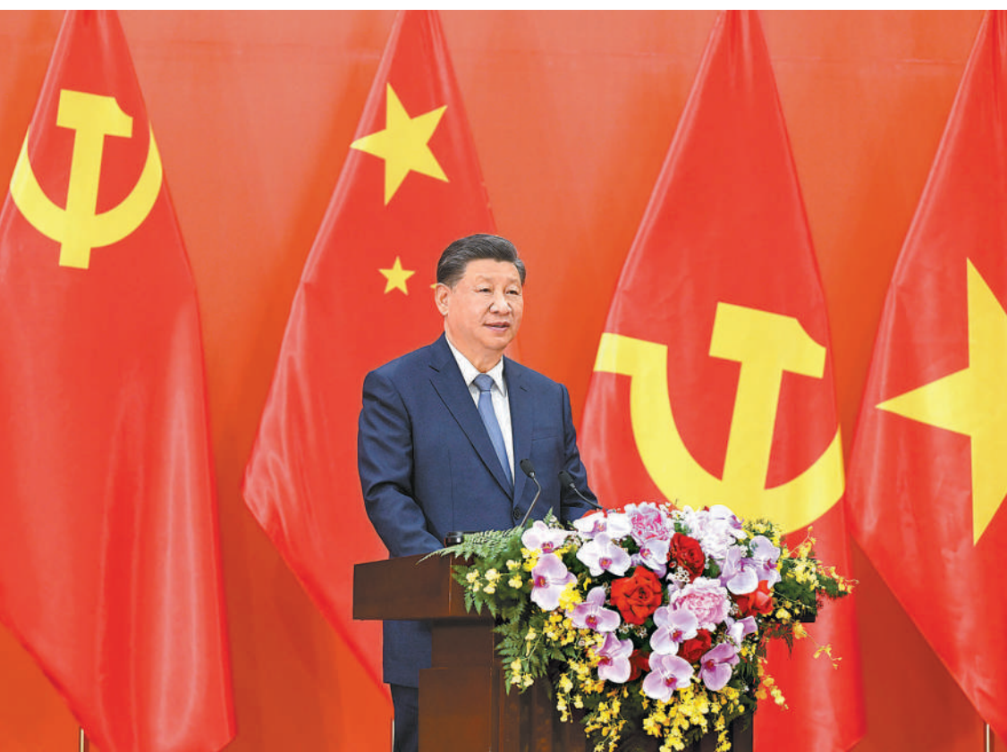
当地时间十二月十三日下午，中共中央总书记、国家主席习近平和夫人彭丽媛在河内同越共中央总书记阮富仲夫妇共同会见中越两国青年和友好人士代表。这是习近平发表题为《赓续传统友谊，开创中越命运共同体建设新征程》的重要讲话。

新华社河内12月13日电(记者倪四义、宿亮、孙一)当地时间12月13日下午，中共中央总书记、国家主席习近平和夫人彭丽媛在河内同越共中央总书记阮富仲夫妇共同会见中越两国青年和友好人士代表。