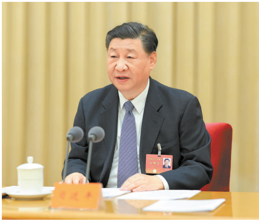
12月11日至12日，中央经济工作会议在北京举行。中共中央总书记、国家主席、中央军委主席习近平出席会议并发表重要讲话。

做好明年经济工作，要以习近平新时代中国特色社会主义思想为指导，全面贯彻落实党的二十大和二十届二中全会精神，坚持稳中求进工作总基调，完整、准确、全面贯彻新发展理念，加快构建新发展格局，着力推动高质量发展，全面深化改革开放，推动高水平科技自立自强，加大宏观调控力度，统筹扩大内需和深化供给侧结构性改革，统筹新型城镇化和乡村全面振兴，统筹高质量发展和高水平安全，切实增强经济活力、防范化解风险、改善社会预期，巩固和增强经济回升向好态势，持续推动经济实现质的有效提升和量的合理增长，增进民生福祉，保持社会稳定，以中国式现代化全面推进强国建设、民族复兴伟业。