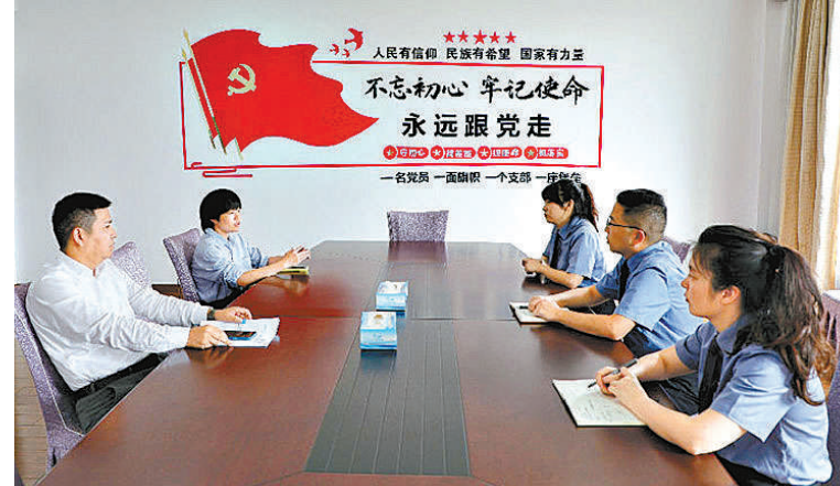
2023年5月,检察官回访企业,了解企业整改情况。

“涤除车检行业腐败风气,提高车检的含金量,既是办好民生小事,也是护航民营经济行稳致远。”江北区检察院检察长董顺来告诉记者,“人选最高检评选的检察机关全面履行检察职能推动民营经济发展壮大典型案例,说明该案的办理贯彻了‘个案办理一类案监督一系统治理’的溯源治理检察路径,同时为检察机关落实浙江省营商环境优化提升‘一号改革工程’提供了宁波江北实践。”