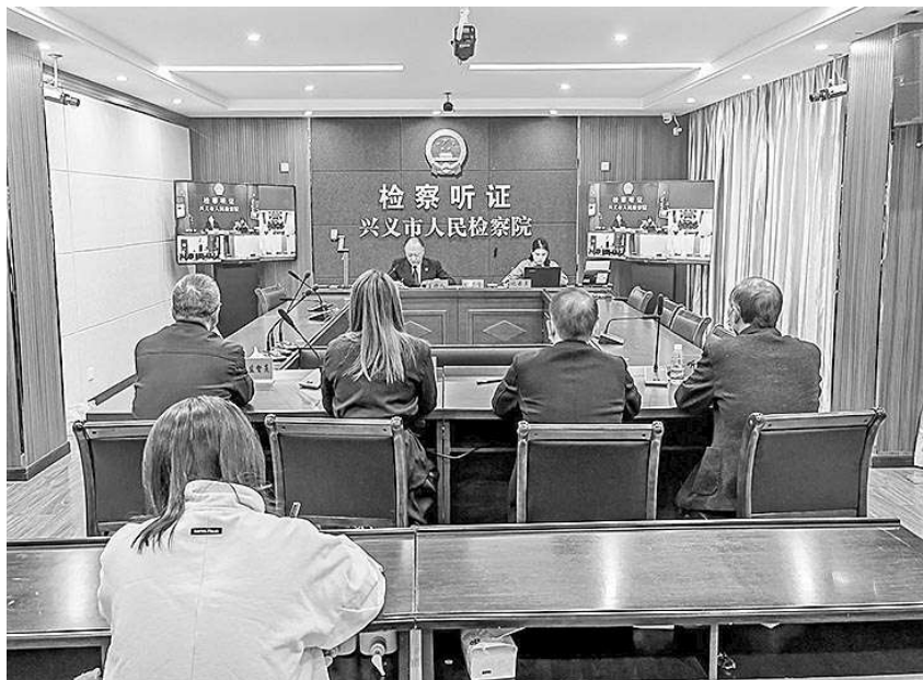
黔西南州兴义市检察院检察官对10件危险驾驶案进行类案集中听证。

强化监督衔接,凝聚工作合力。黔西南州检察院与黔西南州纪委监委会签《黔西南州检察机关与监察机关在办理职务犯罪案件中加强衔接配合工作机制(试行)》,通过加强线索移送、强化案件会商等方式,深化职务犯罪案件办理,进一步凝聚依法惩治腐败的强大合力,共同推动反腐败工作高质量发展。(张天峰)