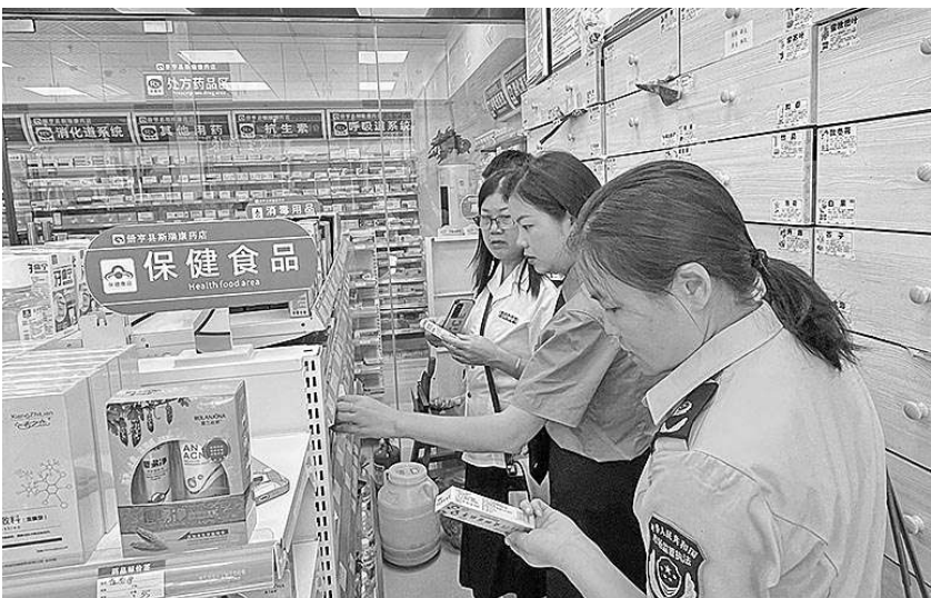
册亨县检察院检察官与该县市场监督管理局、卫生健康局工作人员到辖区部分药品零售店开展(抑)菌剂突出问题整治成效“回头看”。