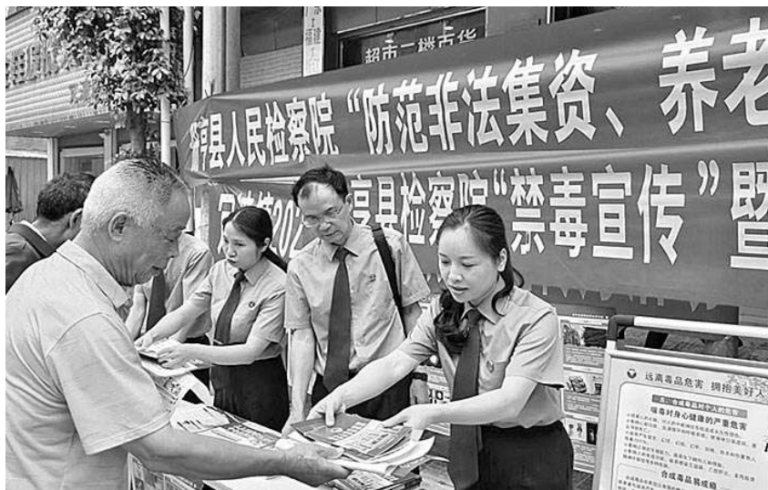
册亨县检察院检察官走进辖区街道开展系列普法宣传活动,把普法宣传搬到群众“家门口”。