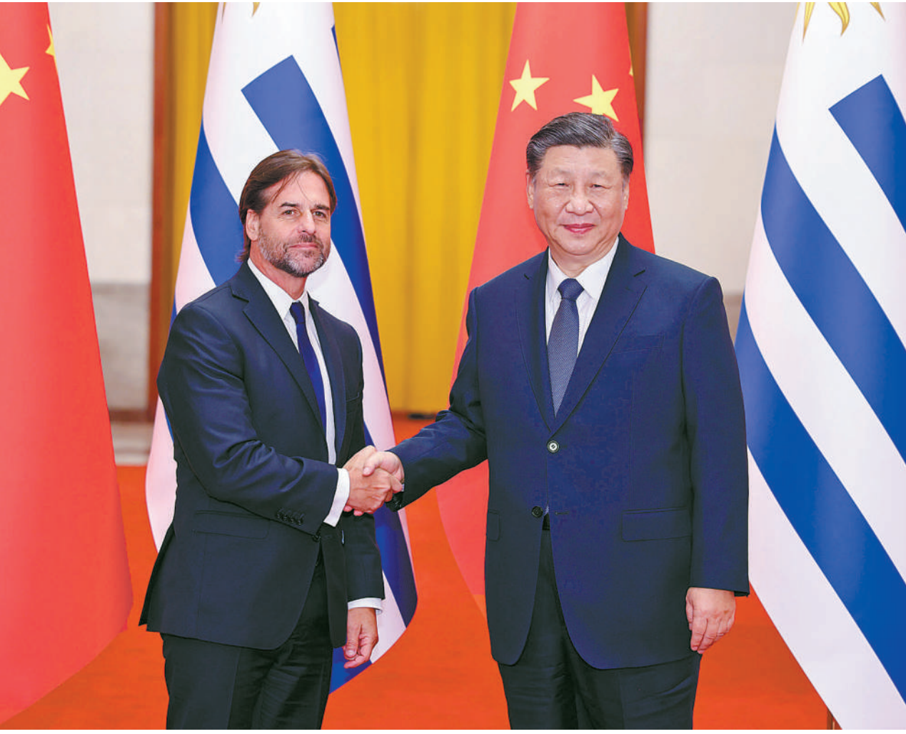
11月22日下午，国家主席习近平在北京人民大会堂同来华进行国事访问的乌拉圭总统拉卡列举行会谈。这是会谈前，习近平在人民大会堂北大厅为拉卡列举行欢迎仪式。

新华社北京11月22日电(记者杨依军) 11月22日下午，国家主席习近平在人民大会堂同来华进行国事访问的乌拉圭总统拉卡列举行会谈。两国元首宣布，将中乌关系提升为全面战略伙伴关系。