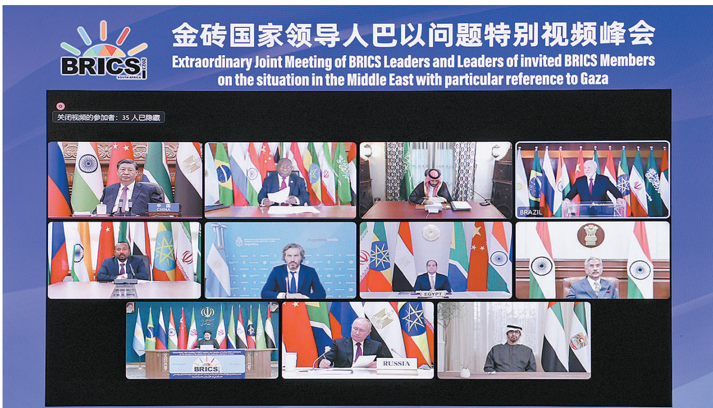
11月21日晚,国家主席习近平出席金砖国家领导人巴以问题特别视频峰会并发表题为《推动停火止战 实现持久和平安全》的重要讲话。