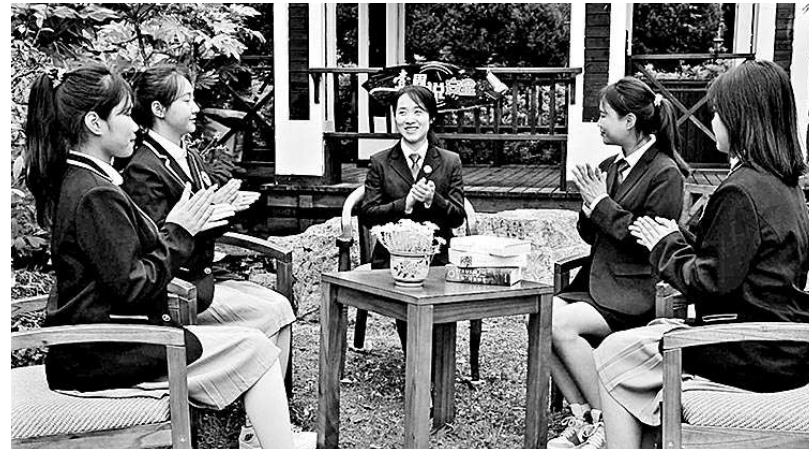
近日,贵州省贵阳市云岩区检察院“云树”未检工作室检察官接受贵阳市女子职业学校“查周说安全”普法栏目的邀请,现场为学生们解答防性侵、预防电信诈骗网络诈骗等方面的法律知识。

本报讯(记者李轩甫 通讯员刘璨) 日前,记者从海南省海口市琼山区检察院获悉,该院成立了“海青蓝”知识产权综合办案组,集中统一履行涉知识产权刑事、民事、行政、公益诉讼检察职能,打造“捕、诉、监、防、治”全链条一体化综合司法保护体系。为高质量开展辖区知识产权保护和办理知识产权案件,该院制定了《进一步加强知识产权保护工作方案》,细化办案组的目标任务、工作举措、办案机制等。办案组自成立以来,共监督公安机关立案1件、依法介入5件,引导公安机关侦查取证60余条,审查行政机关移送案件6件。