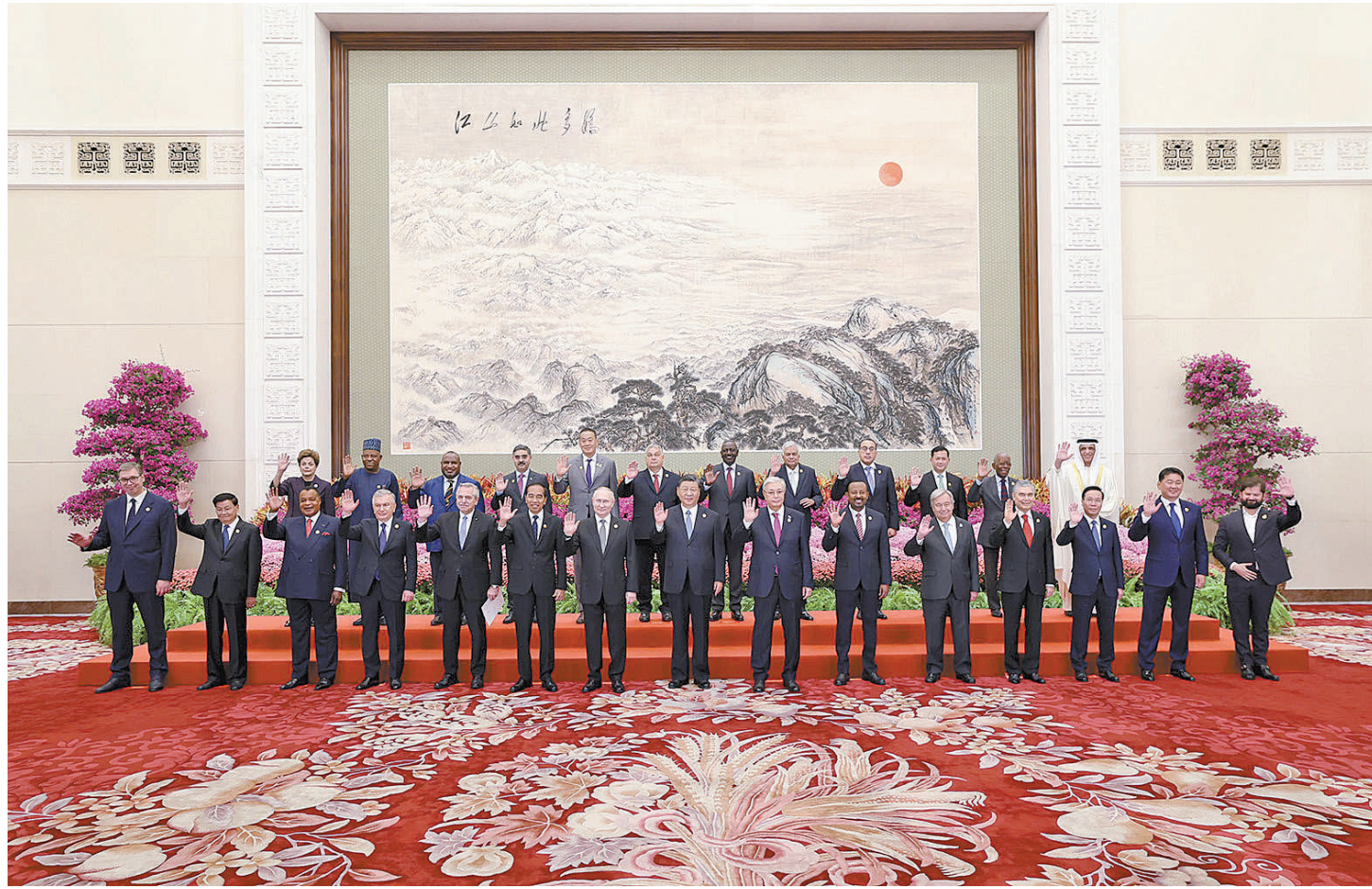
10月18日上午,国家主席习近平在北京人民大会堂出席第三届“一带一路”国际合作高峰论坛开幕式并发表题为《建设开放包容、互联互通、共同发展的世界》的主旨演讲。