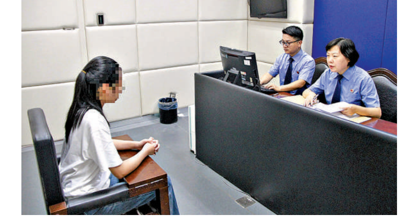
吴中区检察院办案检察官对被告人进行讯问。

该案移送吴中区检察院审查起诉后,考虑到7人中大部分是在校大学生,承办检察官遂与相关学校沟通联系,在充分了解他们的学习情况、在校表现后,决定对他们继续适用取保候审。