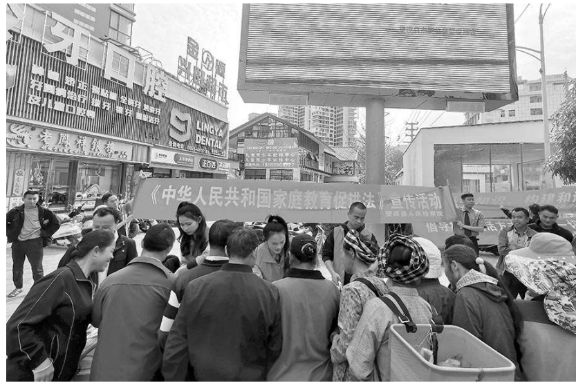
望谟县检察院干警利用赶集日向群众发放法律知识宣传手册。