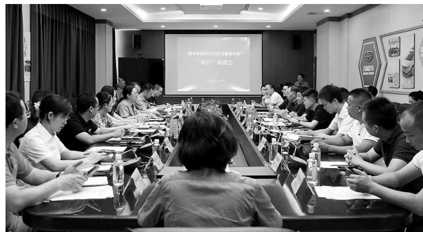
观山湖区检察院召开以“服务保障民营经济高质量发展”为主题的“两长”座谈会。

机关“大数据”碰撞分析，发现相关单位在管理中存在的潜在问题，实现从“个案监督”到“类案监督”再到“社会治理”的递进性监督。如就医美行业虚假广告、非法行医、价格欺诈等违法犯罪活动，该院开展“天医并肩”公共卫生行业检察监督专项行动，筛选问题线索52件，并对其中9件线索进行公益诉讼立案调查，推动医美行业建立长效机制，持续打击整治医美行业乱象。再如，该院针对刑事案件办理中发现的利用“空壳企业”实施犯罪的线索，与市场监管局、税务局、水务公司、人社局等单位对异常案件进行“画像”式调查。经筛查，该院发现虚假注册公司24家，监督注销未实际经营的“僵尸”企业，通过检察办案护航优化法治化营商环境。（石脚 宋朝）