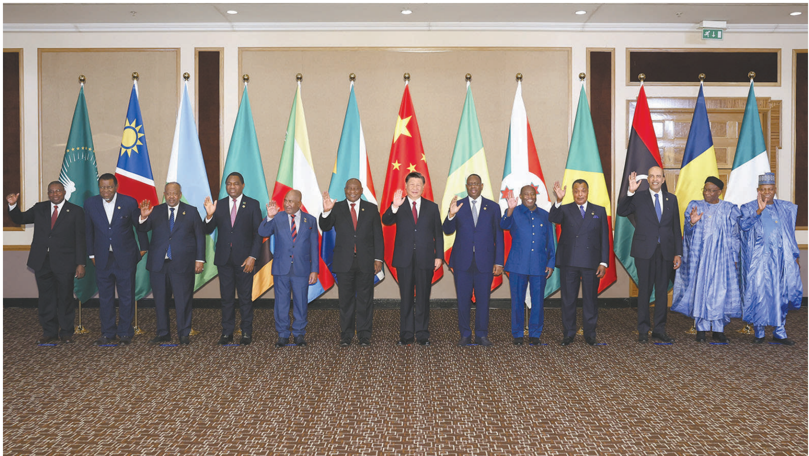
当地时间8月24日晚，国家主席习近平和南非总统拉马福萨在约翰内斯堡共同主持中非领导人对话会。

非盟轮值主席、科摩罗总统阿扎利，中非合作论坛非方共同主席国、塞内加尔总统萨勒，非洲次区域组织代表赞比亚总统希奇莱马、布隆迪总统恩达伊施米耶、吉布提总统盖莱、刚果(布)总统萨苏、纳米比亚总统根哥布、乍得总理凯布扎博、利比亚总统委员会副主席库尼、尼日利亚副总统谢蒂马，以及非盟委员会代表穆昌加等出席。这是会前集体合影。