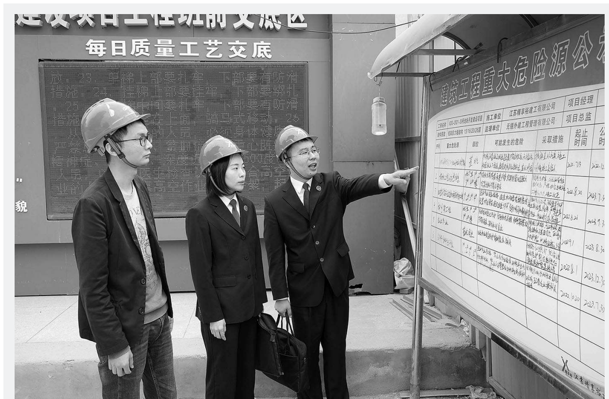
3月29日,江苏省无锡市梁溪区检察院在办理一起挪用资金案时,结合案件办理主动深入企业,问需法治需求,帮助企业查漏补缺。针对企业系建筑行业的特点,检察官深入建设施工一线,宣讲“八号检察建议”,建议企业持续规范监督检查,切实筑牢安全生产防线。