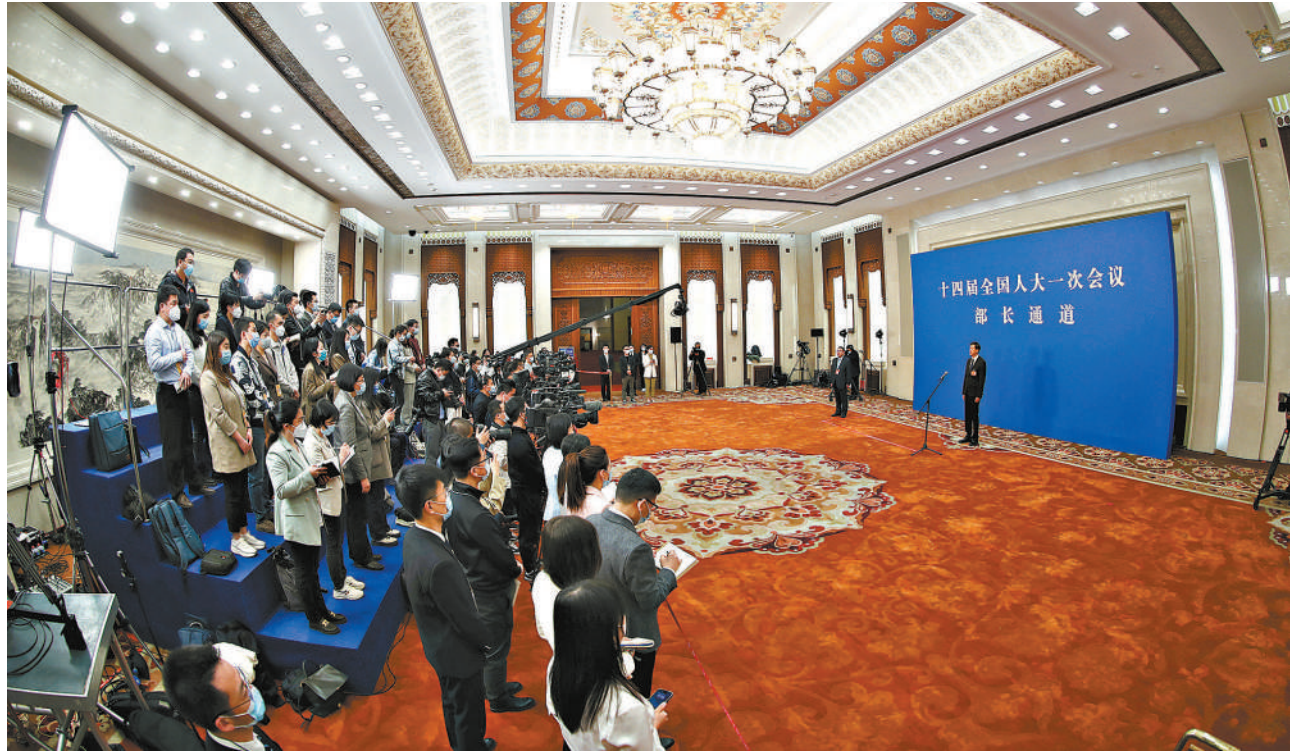
3月12日,第十四届全国人民代表大会第一次会议举行第三场“部长通道”采访活动。国家体育总局局长高志丹接受媒体采访。

三是加快立法进程。参照其他单行立法例,在修订海洋环境保护法时单设或增设海洋公益诉讼条款,或者在检察公益诉讼专门立法中设立海洋检察公益诉讼专章,根据海洋环境保护特点,明确保护要求和程序。