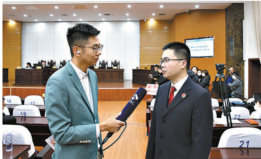
检察官向当地媒体介绍办案情况