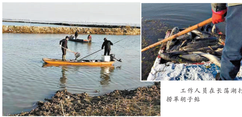
工作人员在长荡湖打捞革胡子鲶