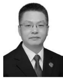
重庆市荣昌区 检察院党组书记、 检察长 曾庆云

最高检党组提出能动履职、诉源治理，这是检察机关全面贯彻习近平法治思想的具体实践，也是以检察工作高质量发展服务保障经济社会高质量发展的必然路径。重庆市荣昌区检察院围绕“如何能动履职”积极探索，坚持质效导向，把握“三个基点”，下足“四个功夫”，针对个案、类案发生的原因，通过制发检察建议等方式，促进从源头上防范相关案件反复发生，实现治理与治理并重，更好地将能动履职落到实处。