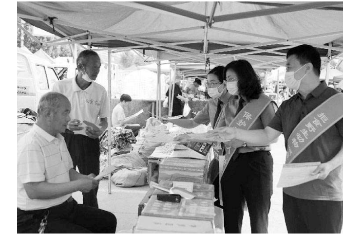
近日，山东省滨州经济技术开发区检察院干警与滨州市自然资源和规划局、滨州市公安局经济技术开发区分局工作人员，到集市、花鸟市场联合开展野生动物保护宣传活动。