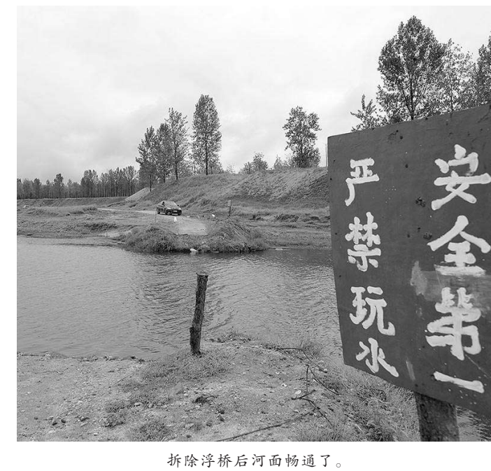
拆除浮桥后河面畅通了。

据悉，海东市宗教活动场所共1086家，国家级、省级、市县级文物保护单位所占比重较大，但市内宗教活动场所分布较散且大多地理位置偏僻、交通不便，导致消防水源、设施匮乏，日常指导监管、隐患整改向致、扑救火灾困难，消防监管和火灾防范难度大。海东市消防救援支队及时研判并召开全市视频会议，通过远程视频开展自查自纠工作。同时市消防救援支队联合统战、发改、民宗、住建、公安等13个部门联合印发“防控联系工作机制”，进一步明确相关行业部门的消防监管责任，形成长效机制。 今年6月，海东市检察院对全市宗教场所消防安全隐患整治情况跟进监督发现，该市宗教活动场所消防安全隐患均得到了有效整改。