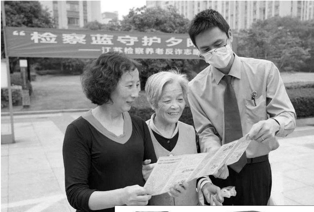
▲9月28日，江苏省常州市武进区检察院组织干警到区金太阳颐养中心，开展“检察蓝守护夕阳红”养老反诈志愿服务。