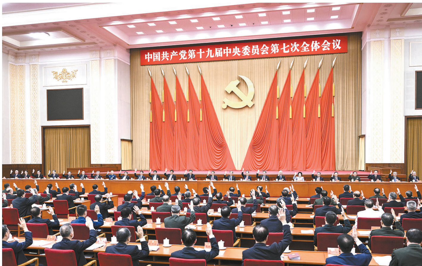
中国共产党第十九届中央委员会第七次全体会议，于2022年10月9日至12日在北京举行。中央委员会总书记习近平作重要讲话。