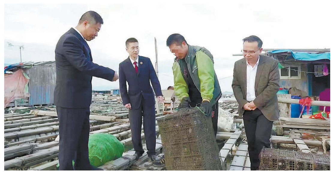
连江县检察院干警走访涉渔社区矫正对象,深入了解其出海作业情况及相关需求。

为此,连江县检察院走访了沿海地区社区矫正人员,并与各乡镇司法所召开座谈会了解情况。 “渔船每次出海的时间都很长,由于海上信号不稳定,渔民不能像在陆地上一样随时报位置信息。而且出海捕鱼有时需要跨区域作业,请假外出困难,请假手续审批繁琐。这些现实问题使得社区矫正管理局不能轻易审