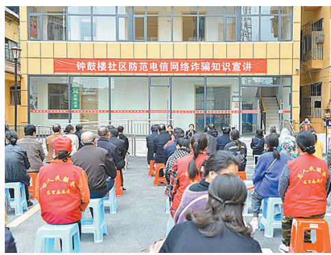
左图:承办检察官远程提审犯罪嫌疑人。