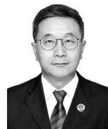
□新疆维吾尔自治区昌吉回族自治州检察院党组书记、检察长 张斌

我院还结合素能培训、选树典型等多种手段,进一步激发检察干警对各项工作的积极性,促使检察人员真正成为自身办案的管理者、规范运行的受益者和司法善意的传递者。