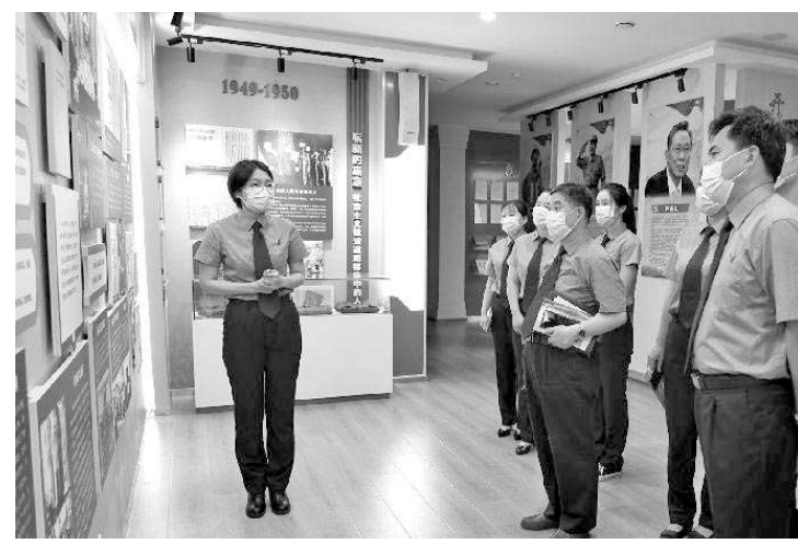
近日,山东省莱西市检察院开展“党员政治生日”主题党日,该院党组书记、检察长为9名党员送上“政治生日”贺卡。图为9名党员参观初心体验馆。