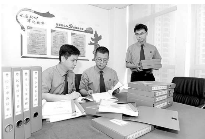
考核小组根据考核情况对相关工作细则进行修改完善

在分类管理的基础上,我院因人施策,探索建立了“三个区分”和“三个紧贴”考核标准,即区分领导干部与普通干警,区分司法行政、司法辅助和司法办案人员,区分专岗专案与