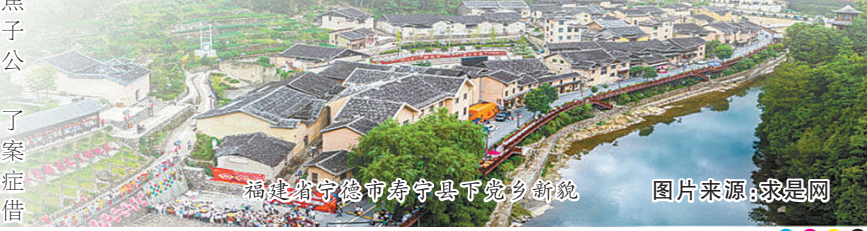
福建省宁德市寿宁县下党乡新貌

党史学习教育远非一时之功,作为新时代检察人,我们将继续发扬“弱鸟先飞”“滴水穿石”的闽东精神,把人民群众对美好生活的向往作为奋斗目标,引导和激励广大检察干警更加自觉地传承红色基因,把党史学习教育成果转化为干事创业的强大动力,为谱写“宁德篇章”作出新的更大贡献,以优异成绩迎接党的二十大胜利召开。