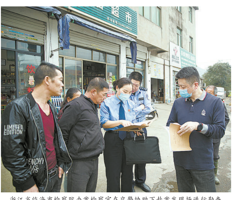
浙江省临海市检察院办案检察官在交警协助下赴案发现场进行勘查

“信访工作说到底就是与人打交道,建立信任,想群众所想、急群众所急,法结、心结一起解。”吴志刚表示,近年来,红安县检察院主动联系民政、教育等部门,建立健全司法救助与社会救助衔接机制,构建工作信息互通共享工作模式。通过加强司法救助案件线索移送、联合回访、及时更新台账等形式,实现对因案致贫致困的贫困户、边缘易致贫户精准帮扶。