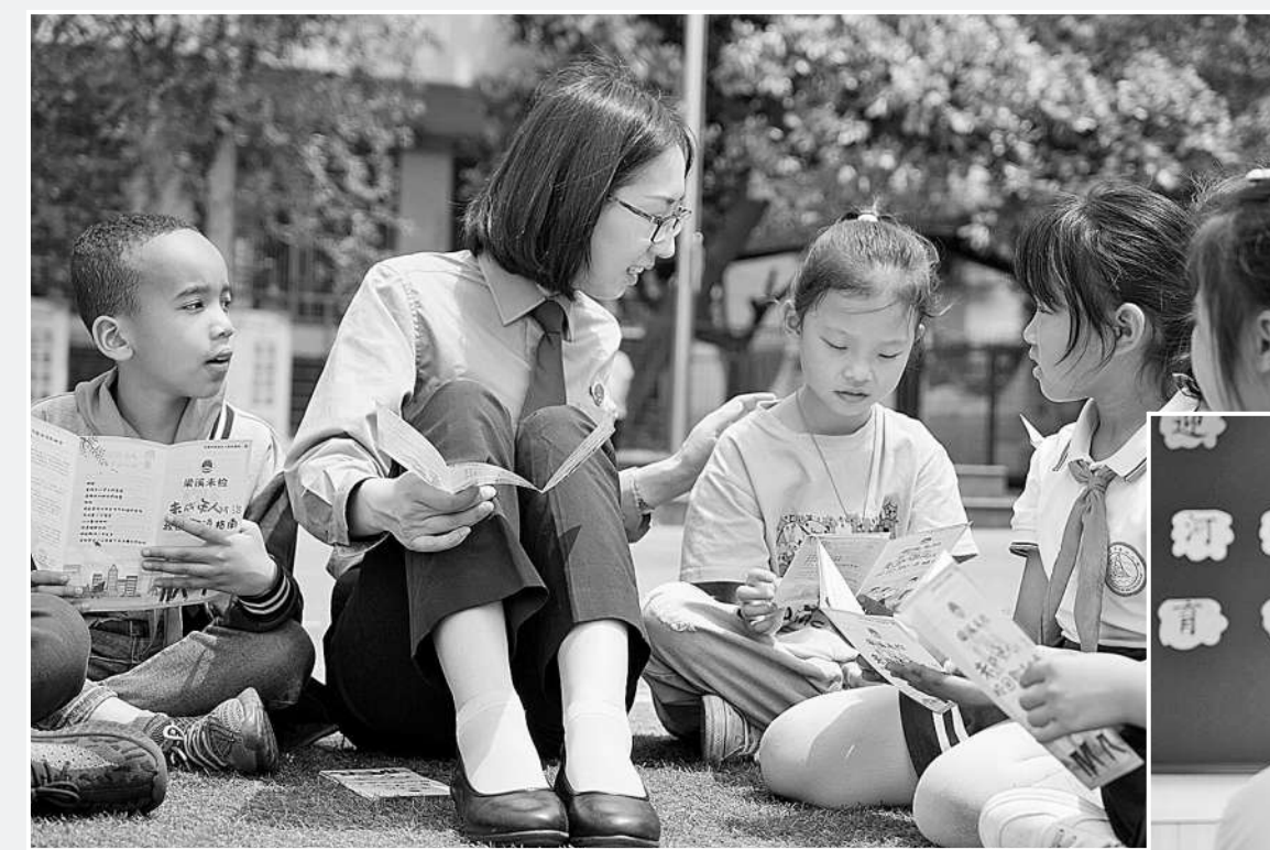
近期,江苏省无锡市梁溪区检察院举办“学习法律 共护未来”系列活动。该院组织法治副校长深入辖区中小学校、职业院校开展法治教育活动15场次,受教育人数共计6万余人。 上图:检察官向孩子们讲解相关法律知识。右图:具有心理咨询师资格的检察官与存在不良行为的学生进行一对一教育谈话。 本报记者卢志坚 通讯员周庆圆 范曾摄

实重复信访治理和院领导包案办理首次信访,提升控申案件办理质量,大力推行公开听证,用实际行动把各项重点工作抓得更实更好。”徐向春表示。