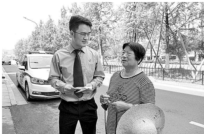
近日,浙江省宁海县检察院干警在客流量较大的街道开展养老诈骗宣传。检察官用老人们听得懂的当地方言,叮嘱其守好“钱袋子”。活动中,检察官为老人答疑解惑30余次,发放宣传资料260余份。

本报北京6月23日电(记者徐日升 见习记者刘亭亭) 记者从最高人民检察院获悉,山西出版传媒集团有限责任公司原党委委员、副总经理吕建新(副厅级)涉嫌受贿一案,由山西省监察委员会调查终结,移送检察机关审查起诉。经山西省检察院交办,由吕梁市检察院审查起诉。日前,吕梁市检察院依法以涉嫌受贿罪对吕建新作出逮捕决定。该案正在进一步办理中。