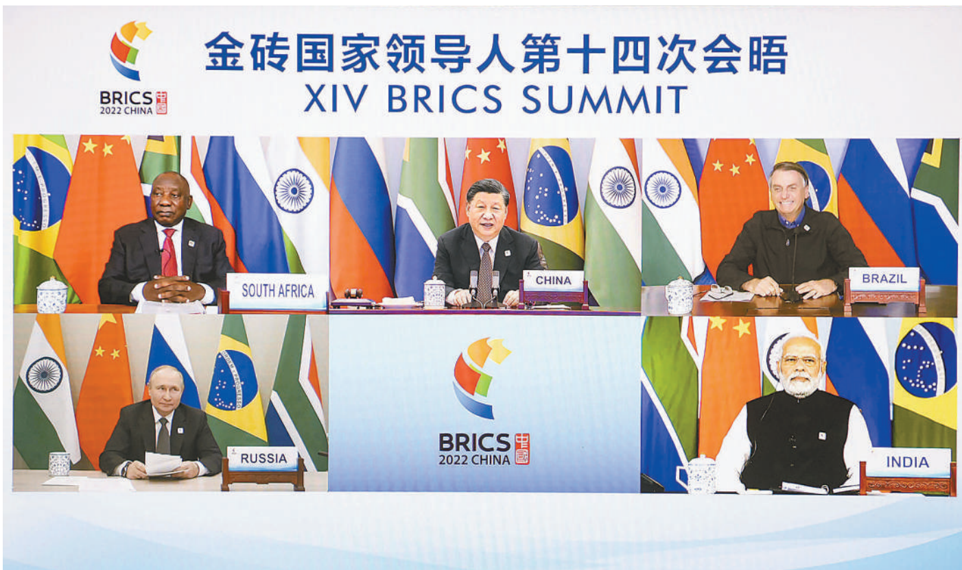
6月23日晚，国家主席习近平在北京以视频方式主持金砖国家领导人第十四次会晤并发表题为《构建高质量伙伴关系 开启金砖合作新征程》的重要讲话。