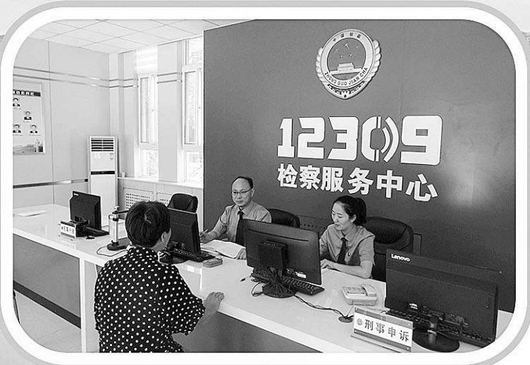
▶检察官接待当事人

通过借用“外脑”，鱼台县检察院对“抗点”又有了新的认识：该案并非孤案，案情复杂、牵扯面广、分歧大，“抗”就应该观点鲜明，直指“病灶”，实现“办理一案，治理一片”的监督效果。既然检、法两院对案件事实没有