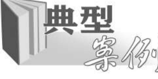
攻坚战提供有力法治保障。

“手中有粮”才能“心里不慌”。充足完备的防疫物资和生活物资,是疫情防控能力建设的重要组成部分,关系人民群众的身心健康和基本生活保障,既是保民生、稳民心的需要,也有利于调动广大人民群众同心协力、共克时艰。在全国人民同舟共济、团结一心防控疫情的形势下,仍有不法之徒无视国法,破坏疫情防控民生、物资保障,扰乱市场经济秩序,试图发“疫情财”。如有的为牟取私利,未经注册商标人许可,生产、销售防护服、抗原快速检测试剂等防控物资,不仅侵犯了他人注册商标权,而且容易给疫情防控带来风险隐患;有的在疫情期间囤积食品哄抬物价严重扰乱市场秩序;有的在进行区域管控的情况下,利用社区团购这一新型网购方式和特殊时期人们迫切购买物资的心理,假借“社区团购”实施诈骗犯罪。