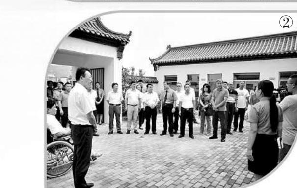
图② 淄博:驻鲁全国人大代表视察淄博市生态公益诉讼检察工作。