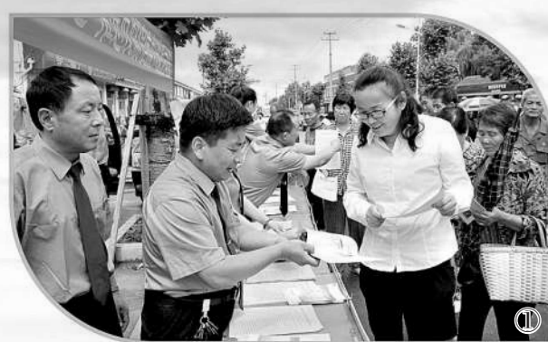
图① 博山:检察官在街头宣传森林防火法律知识。