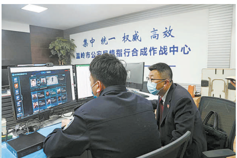
▶浙江省温岭市检察院检察官通过人脸识别系统核查社区矫正人员外出情况