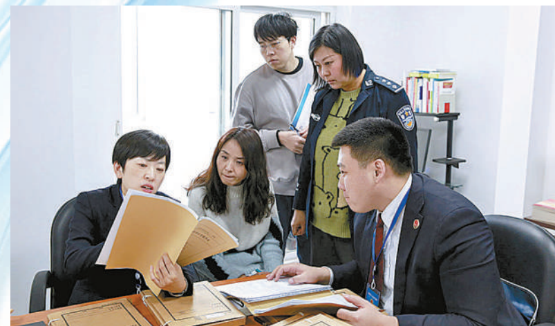
▲辽宁省沈阳市检察院巡回检察组向社区矫正工作人员反馈问题