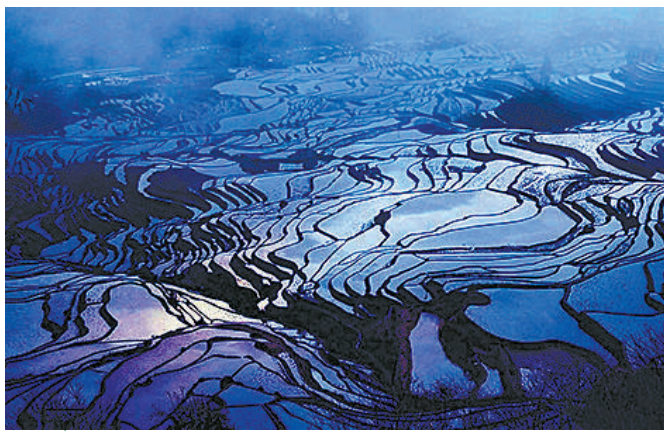
薄雾漫天梯