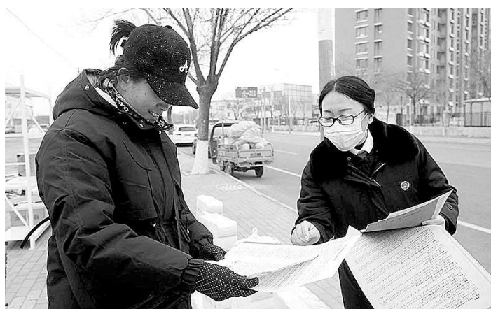
近日,山东省东营市垦利区检察院组织干警开展法治宣传活动,他们深入社区,向群众讲解检察机关接受信访举报的相关知识。 本报记者卢金增 通讯员王艳青 姜展昱摄