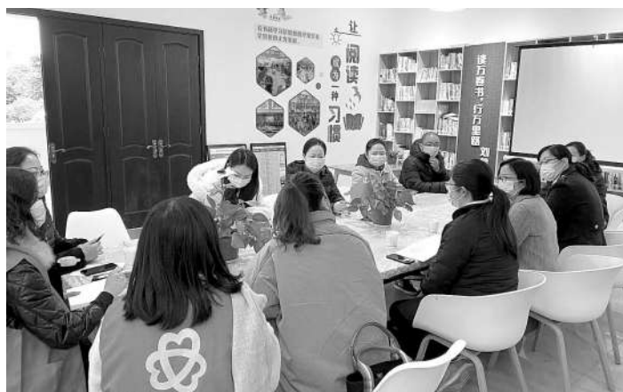
近日,四川省成都市温江区检察院向一名未成年人家长发出了“责令接受家庭教育指导令”,督促其正确履行监护职责,接受家庭教育指导,改善家庭教育管理方式。 本报记者查洪南 通讯员赵田瑞 蒲川摄

本报讯(记者王玲 通讯员韩雨晴)为推进党建与业务深度融合,防范和化解新形势下金融领域的法律风险,日前,辽宁省沈阳市皇姑区检察院与中国银行沈阳皇姑支行举办座谈会并签订“党建共建”协议。双方将以党建共建促进营商环境优化为切入点,建立长期合作关系,构建工作联席会议制度,依托金融犯罪预防法治讲座等活动,共同构筑防范金融风险长效工作机制,携手为企业、个人提供法律、金融支持和保障,激发双方党建队伍活力,助力法治化营商环境建设。