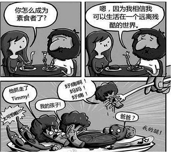
素食主义和反素食主义漫画